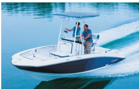
YAMAHA 190 FSH Sport 全長:5.8m 全幅:2.4m 定員:8名 搭載エンジン:1,812cc High Output Engine

アクティブな走りとマリンスポーツファンの多彩なニーズに応えるスポーツボートの展示とヤマハプレミアムヨット EXULT36 Sport Saloonの特別展示。また、日本初上陸のスティックボートを参考出品いたします。気になるボートに触れるチャンスです。ぜひ、この機会にご来場ください。