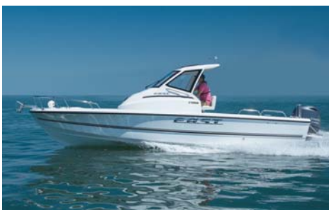
YAMAHA F.A.S.T.23 全長:7.00m 全幅:2.35m 定員:8名 搭載エンジン:F90BETX