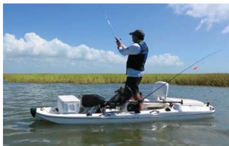
参考出品 スティックボート