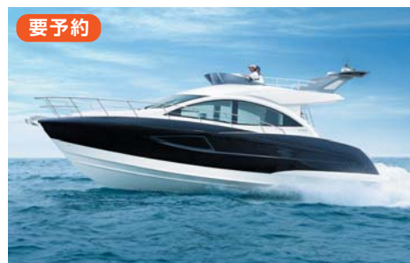
YAMAHA EXULT 36 Sport Saloon 全長:11.98m 全幅:3.97m 定員:12名 搭載エンジン:VOLVO PENTA IPS-500x2