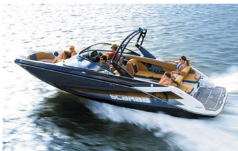
SCARAB 255 HO WAKE 全長:7.62m 全幅:2.54m 定員:12名 搭載エンジン:ROTAX 200HPx2