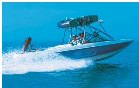
SIGMA AUTOMOTIVE CREEVER 全長:6.72m 全幅:2.2m 定員:10名 搭載エンジン:TOYOTA MIK-D